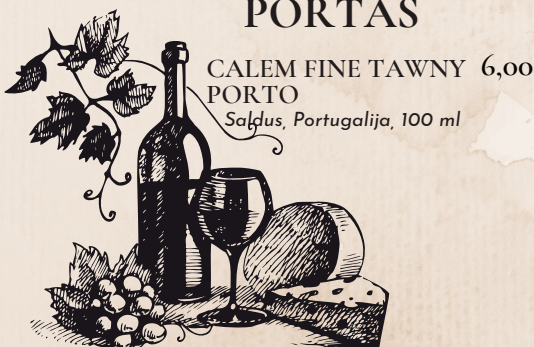
CALEM FINE TAWNY 6,00 PORTO Saldus, Portugalija, 100 ml